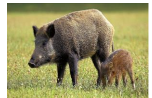
Unsere Jäger: Gustav Rörich Winterbach