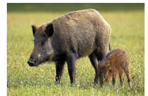
Unsere Jäger: Gustav Rörich Winterbach